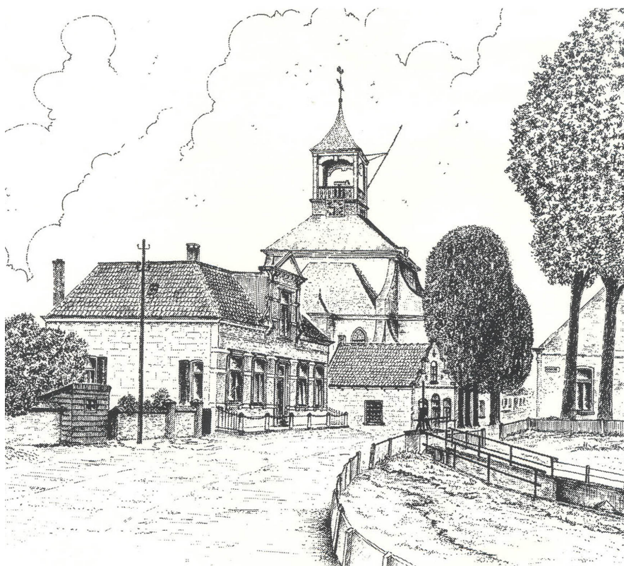
Protestantse Gemeente - Hooge Zwaluwe